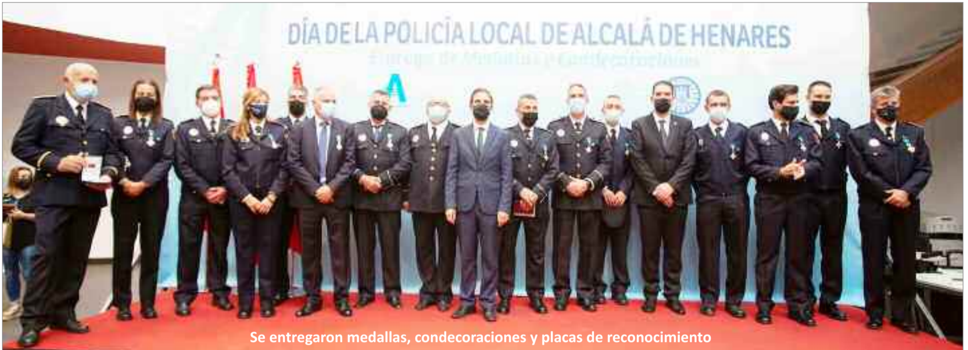
Se entregaron medallas, condecoraciones y placas de reconocimiento

El alcalde de Alcalá de Henares, Javier Rodríguez Palacios, presidió el acto de entrega de medallas y condecoraciones con motivo del Día de la Policía Local, que se celebra tradicionalmente en torno a la Festividad de la Virgen del Val, patrona de la ciudad y del cuerpo.